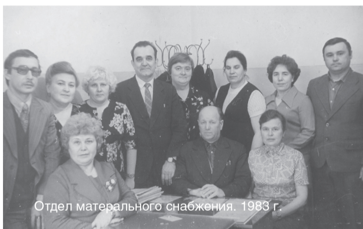
Отдел материального снабжения. 1983 г.