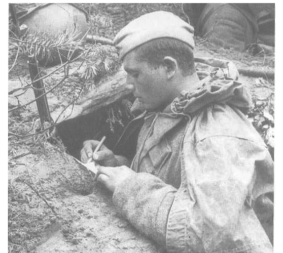
22 июня - День памяти и скорби. Начало Великой Отечественной войны