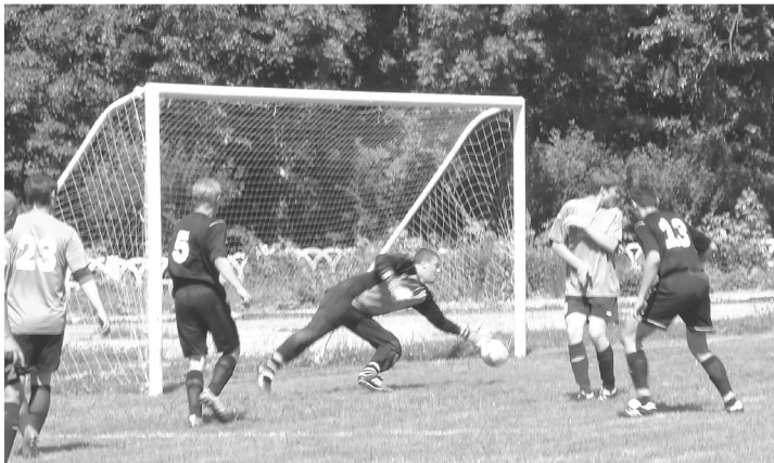
Материалы подготовила Надежда Щербакова