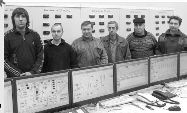
Коллектив газового цеха

На елке шарик светится, А шар земной все вертится... Пусть каждый в этот Новый год Со счастьем новым встретится. Пусть сбудется все доброе, Что звездами пророчится, Желанья все исполнятся И будет все, как хочется! С Новым годом!