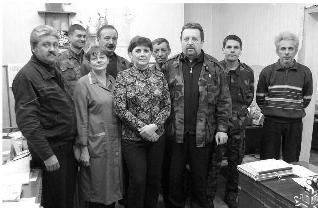
Коллектив доменного цеха

Уходит с небосвода грозный тигр, Его пушистый кролик сменит И, принеся с собою много смеха, детских игр, На кроличьи черты тигриные заменит.