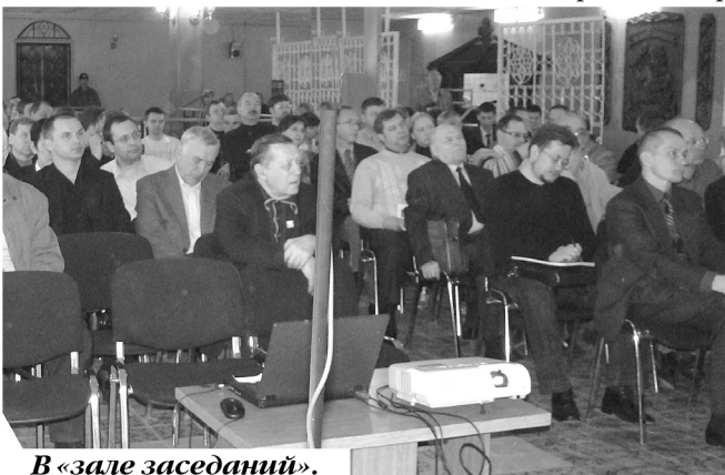
В «зале заседаний».