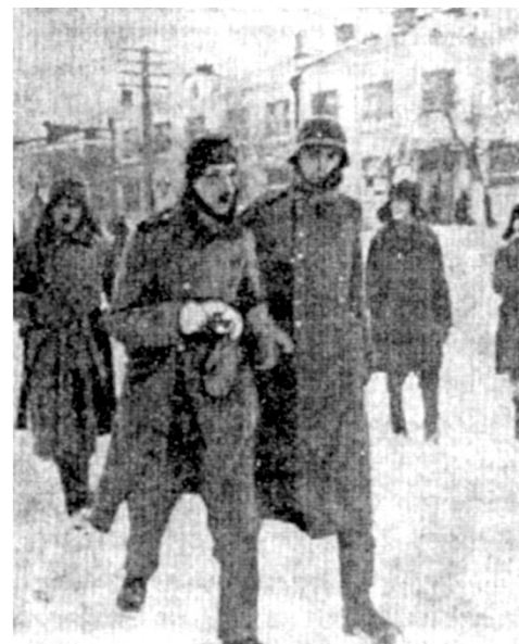
Немцы вошли в Тулу. Но в качестве пленных.