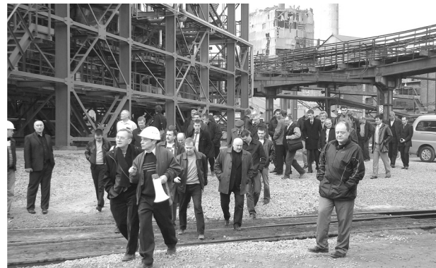
Газоочистка: такого гости еще не видели.