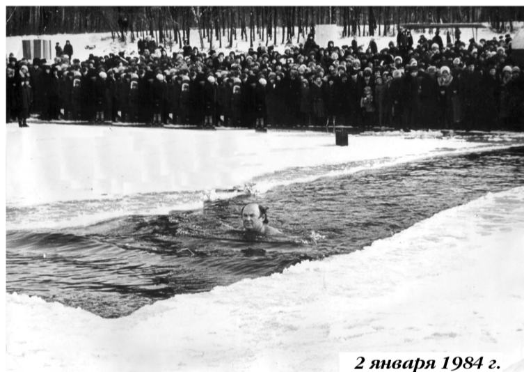
2 января 1984 г.

- Трудно сказать. Спорт предусматривает соревнования, а здесь как соревноваться? Кто больше в проруби просидит? Бывают массовые заплывы под Новый год, но для этого нужна открытая вода. Если она есть, то, значит, имеет плюсовое зна-