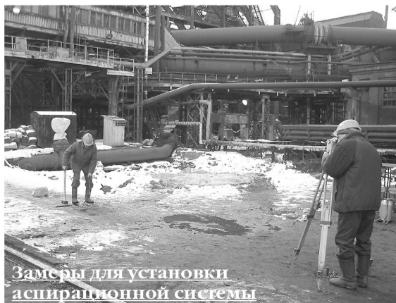
Замесы для установки аспирационной системы