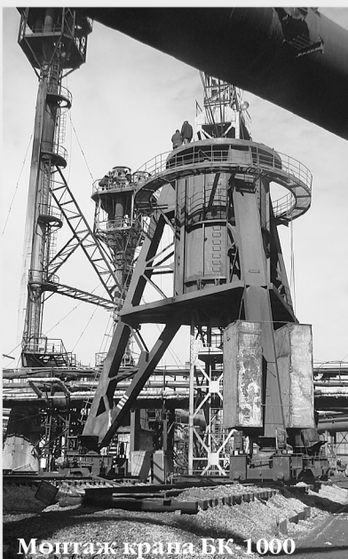
Монтаж крана БК 1000